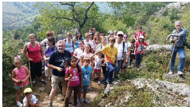
PROGRAMA DESCUBRIENDO SOBRESCOBIO. RUTA CAMÍN D´ACEU. AGOSTO DE 2015

Se inicia en el año 2009 y a través del mismo se pretende descubrir a los menores de nuestro municipio y a los visitantes que se acercan a él o que pasan sus periodos estivales en Sobrescobio el propio Municipio, sus pueblos, su patrimonio etnográfico, natural, cultural e histórico. Para ello, se organizan salidas a los distintos pueblos del municipio par a través de Gynkanas, talleres, excursiones, rutas en la naturaleza y juegos, acercar la cultura a los menores para que sean conscientes y conozcan el medio en el que habitan.