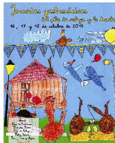
AYUNTAMIENTO DE SOBRESCOBIO www.sobrescobio.es Sobrescobio Turismo