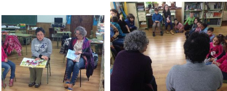
LECTURAS PARA LA IGUALDAD. SOBRESCOBIO, MARZO 2016

Desde el año 2003 Sobrescobio cuenta con un Área de Igualdad integrado por los profesionales de los Servicios Sociales Municipales e integrado en la Concejalía de Igualdad. Desde ese año se han desarrollado actividades coeducativas y de fomento de la lectura, en colaboración con la Concejalía de Cultura, cuestionando los roles y estereotipos de los personajes femeninos y masculinos y a la vez, se realizan talleres de juguetes reciclados no sexistas. Las actividades de fomento de la lectura se llevan a cabo en talleres inter generacionales, en los que participan familias y adultos del municipio.