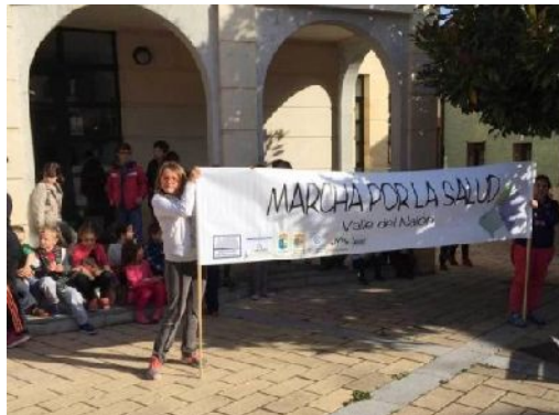
MARCHA POR LA SALUD. 26 DE NOVIEMBRE DE 2015. RIOSECO

Programa que conlleva la promoción de hábitos saludables, dirigido a la población infantil, en el ámbito educativo. Éste programa se lleva a cabo en el mes de noviembre, desde el año 2006, para conmemorar el Día Mundial de los Derechos de la Infancia. La actividad, comienza con la degustación de un desayuno saludable y tiene como objetivo acostumar a los escolares a unos buenos hábitos de alimentación. Después, los niños se dirigen hasta el ayuntamiento, donde leen, ante los responsables políticos del municipio un "Manifiesto por la salud".