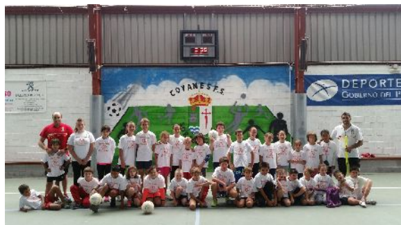
CAMPUS DE FÚTBOL. "SOBRESCOBIU, LA TIERRA COMO ERA". AGOSTO DE 2015

También se utiliza durante el periodo escolar como el lugar en el que se imparten las asignaturas de Educación física de Infantil y Primaria del Aula de Rioseco del CRA Alto Nalón.